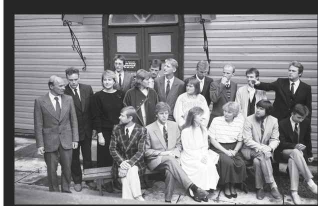
Taasavatud Seminari kaks esimest kursust koos õppejõududega Tartu Kolgata koguduse palvela ees.