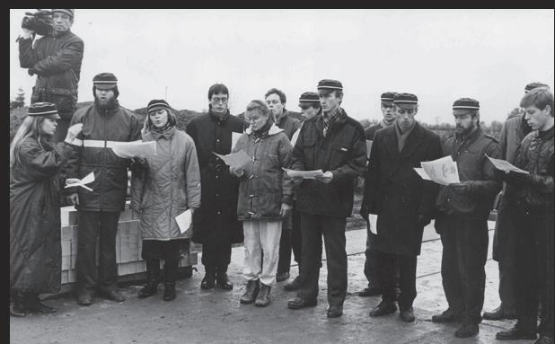
Seminarahoone nurgakivi panek Annelinnas.