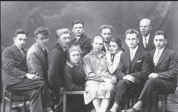
Seminari II lend omavahel 1929. aastal.