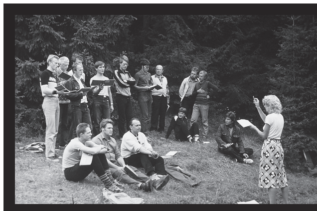
Haraka instituudi suvelaager Holstres 1985. aastal.

1980. aastatel toimusid regulaarselt pastoritele ehk presbüteritele mõeldud õppekogunemised Tallinnas. Neid nimetati konsultatsioonipäevadeks ja need erinesid õpperühmadest, olles küll enesetäiendamise keskkonnaks, kuid võimaldades samas vanempresbüteril EKB Liitu paremini juhtida. Seal jagati informatsiooni, peeti loenguid erinevatel teemadel ja jaotati masinakirjalisi materjale, näiteks piiratud eksemplaride arvuga ilmunud masinakirjalist ajakirja Logos.