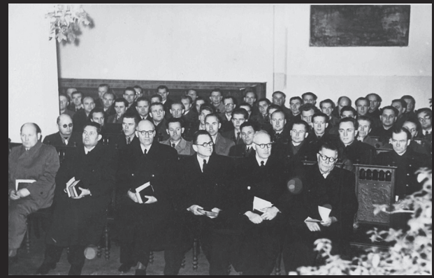
Usuteaduslike kaugõppekursuste avajumalateenistus 1956.

Noores Eesti Vabariigis oli aeg küps baptistide süstemaatilisema teoloogilise hariduse katseks. Jutlustajate Seminaris Keilas alustas tegevust ja 1922. aastal asus õppima kümme noormeest ja neli neidu.