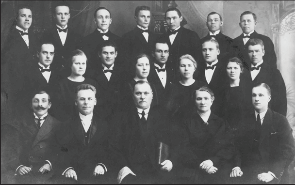
Seminari I lennu lõpetajad.